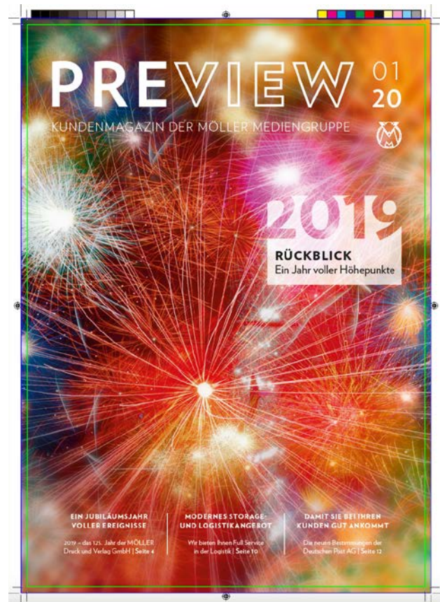
Ansicht mit korrigierten Voreinstellungen