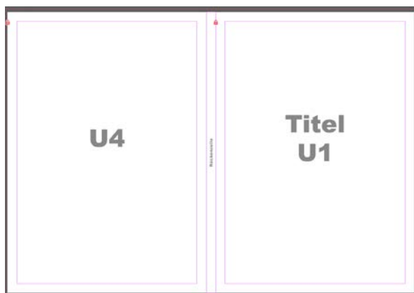
Step 2: Eingabe der Rückenstärke